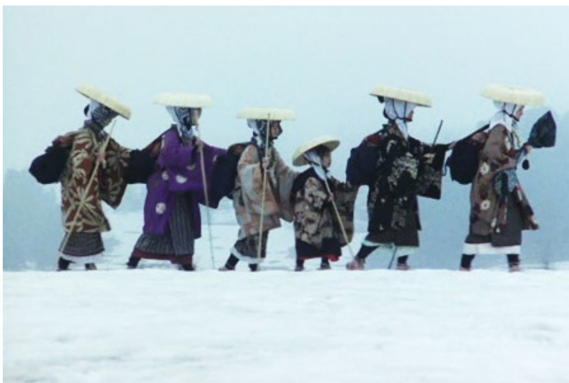
Слепые певицы годзе ходят по отдаленным деревням и поют

Расследование убийства аптекаря Бессе ведет инспектор полиции Иманиси, вскоре к нему присоединяется лейтенант Торазо Хакамада, который подозревает, что Сэндзо Цурукава на самом деле дезертир Хейтаро Ива. Хейтаро Ивабути не захотел идти на войну в Сибирь и сбежал из армии.