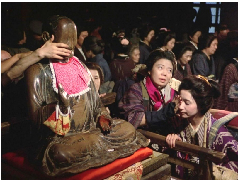
Ритуал промывания глаз

Незрячие глаза Орин – визуальная отсылка к «слепым» статуям Будды, в которых пустые глазницы означают взгляд в пустоту. Статую «слепого» Будды мы видим и в одном из эпизодов фильма, когда Орин участвует в ритуале промывания глаз.