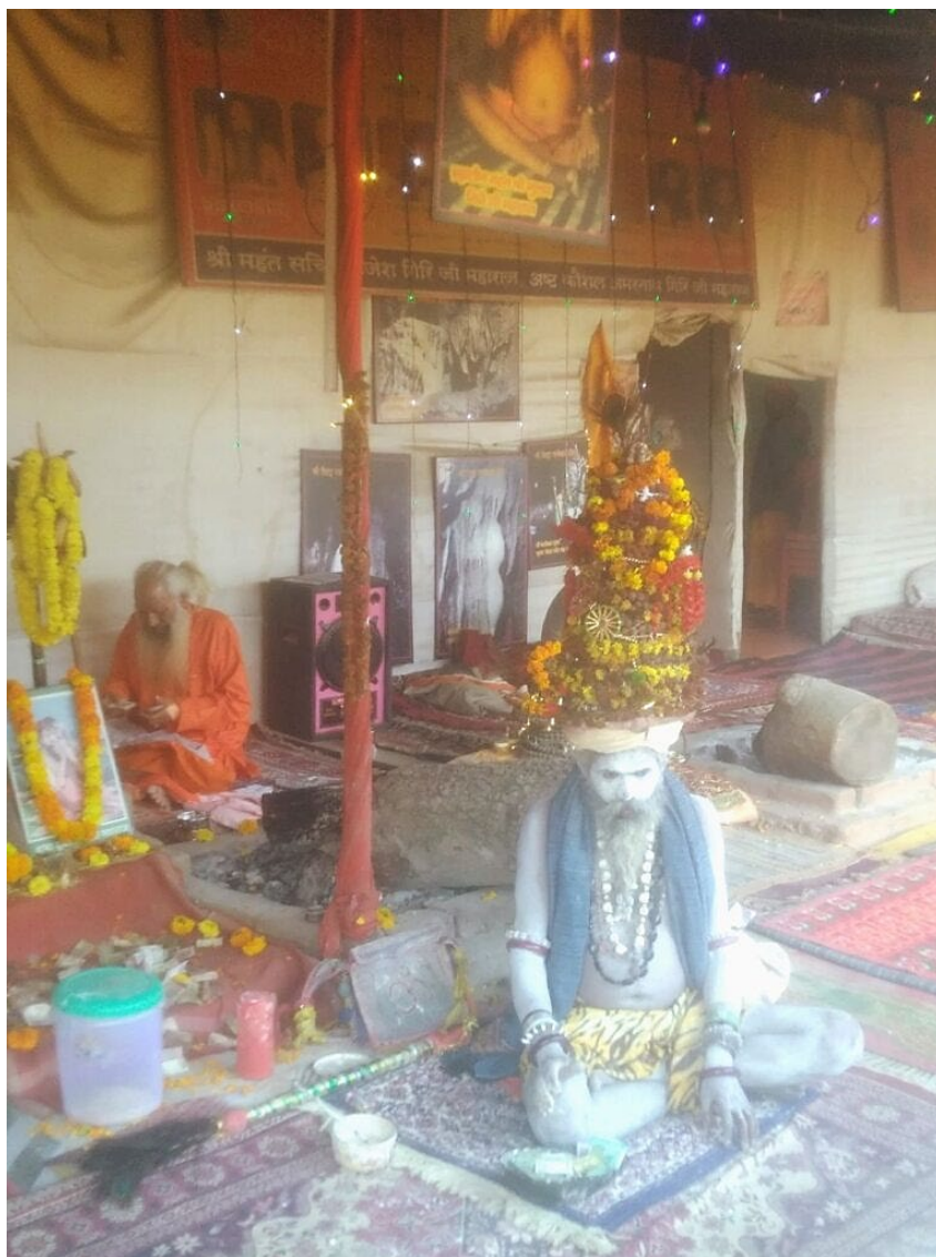
Рудракиный баба в Авахан Акхаде