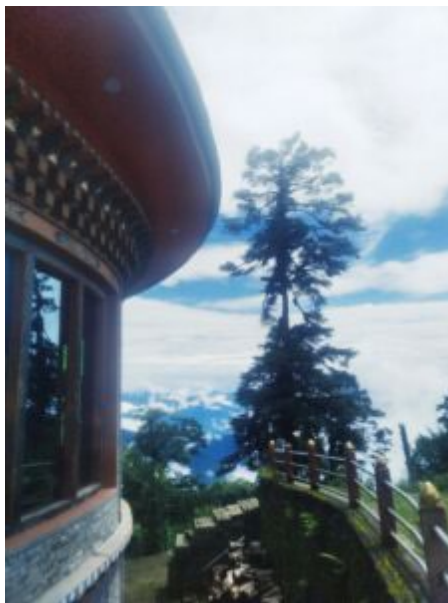
Вид с перевала Дочула

Династия современных королей Бутана, чья история началась в 1907 году с коронации Ургьена Вангчука — не прямые потомки Жабдрунга, но породнились с ними. IV король Джигме Сингье взял в жены четырех сестер, которые были из линии Нгаванга Намгьяла, исполнив тем самым пророчество. Нынешний, V король Джигме Кхесар Намгьял, чьи портреты вместе женой и детьми буквально на каждом шагу, начиная со взлетно-посадочной полосы в Паро, уже объединяет в себе ключевые бутанские семьи. Идея монархии, которая, кстати, конституционная (предыдущий правитель сам ограничил свою власть), выражена в Декларации: «Несмотря на мое правление, я никогда не буду управлять вами как король. Я буду защищать вас, как отец, заботиться, как брат и служить вам, как сын. Мне следует отдавать вам все, не оставляя себе ничего. У меня нет никаких других целей, кроме исполнения ваших надежд и стремлений. Я всегда буду служить вам, днем и ночью, в духе доброты, справедливости и равенства».