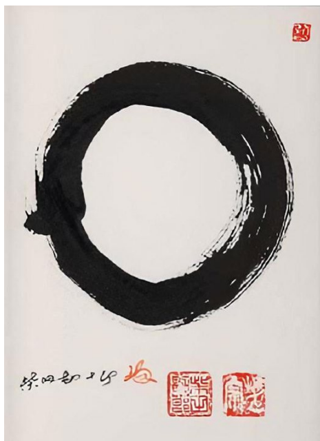
«Энсо». Каллиграфический свиток кисти Сибата Кандзюро XX.

Энсо – образ круга, символическая отметка – где круг одновременно означает и волну, и полную луну, и просветленное сознание.