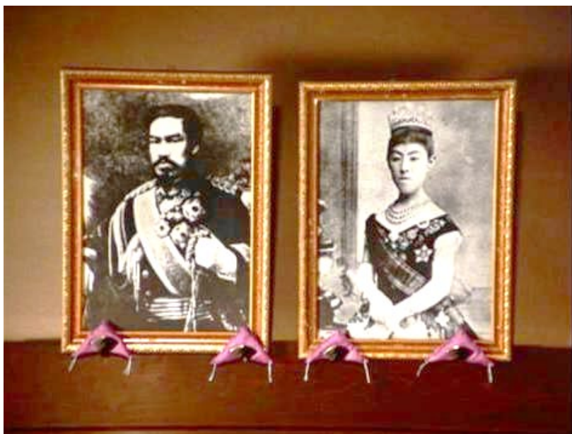
Портреты императора Мэйдзи и императрицы Секэн, кадр из фильма

Отдельно стоит сказать о событиях Первой мировой войны, упоминание о которой есть в фильме.