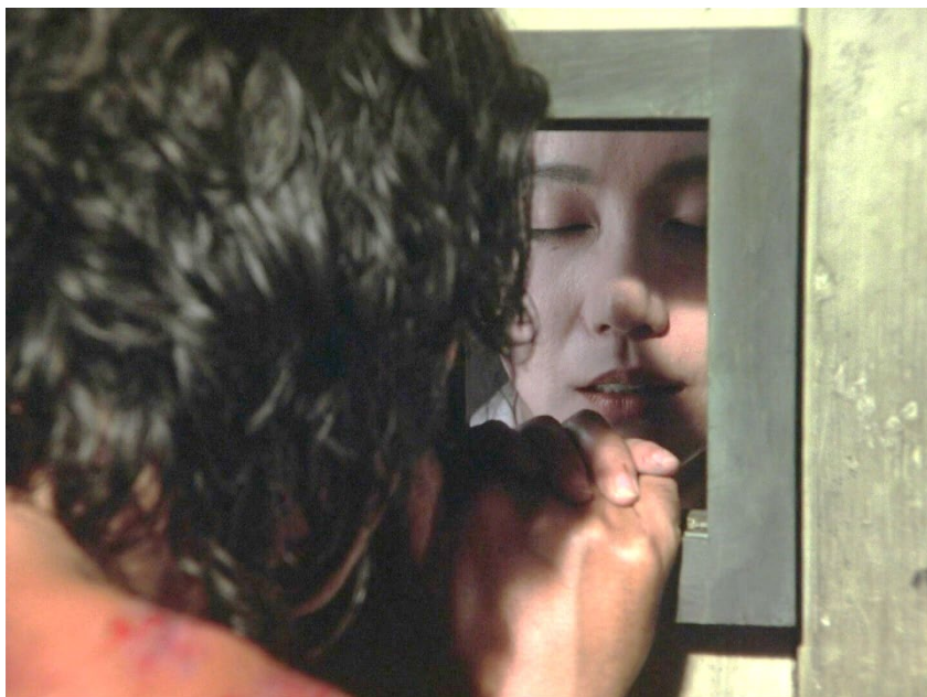
Орин прощается с возлюбленным

Сцена прощания Орин и Сэндзо Цуруквы в тюрьме, когда они признаются друг другу о том, что у каждого из них есть дом, – момент наивысшей близости и доверия. Орин прощается с возлюбленным песней.