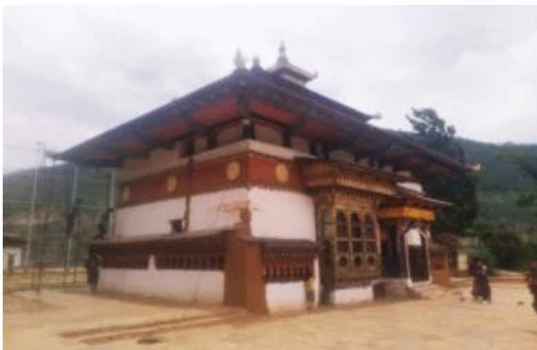
Храм Чимми Лакханг

На этом месте Друкпа Кюнле заточил в ступу с черным основанием демоницу, принявшую образ собаки – во время ритуала святой приговаривал «чи мед», что значит «собаки нет», от чего произошло название храма Чимми Лакханг. Если посетитель – без разницы, какого пола – хочет детей и прочих семейных радостей, то ему нужно вынести деревянные фаллос, стоящий на алтаре, коснуться его основанием макушки для благословения, а затем закрепить специальными ляжками на спине и обойти с ним вокруг храма три раза. В свой визит я долго наблюдала бегающих вокруг Чимми Лакханга мужчин с символом мудрости за спиной, и решила, что тоже достаточно приобщилась. Без сомнений, это эффективный ритуал, потому что в храме есть что-то вроде «Книги отзывов» с фотографиями расплодившихся после соприкосновения со святыней пар, среди которых немало и иностранцев. Таких новорожденных, если это мальчики, называют именем Кюнле, или Кинли, в благодарность святому и ради его покровительства.