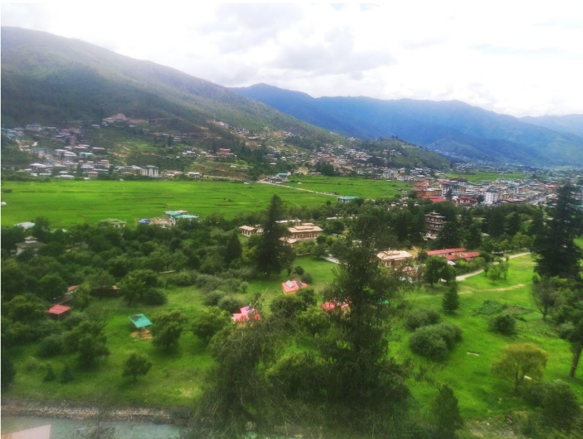
Вид на долину Паро

И «божественный безумец», и Жабдрунг были представителями секты «дракона» Друкпа Кагью, в то время как в духовном авангарде Бутана был еще и Падмасамбхава, основатель школы «старых переводов» Ньингма. Это, считайте, бутанская «троица», чьи изображения можно найти почти во всех храмах королевства. В VIII веке н.э. он из Тибета прилетел в Бутан, подчинив здесь многих демонов и сделав их защитниками учения Будды. Один такой змий по имени Сингье обитал в горах над Паро.