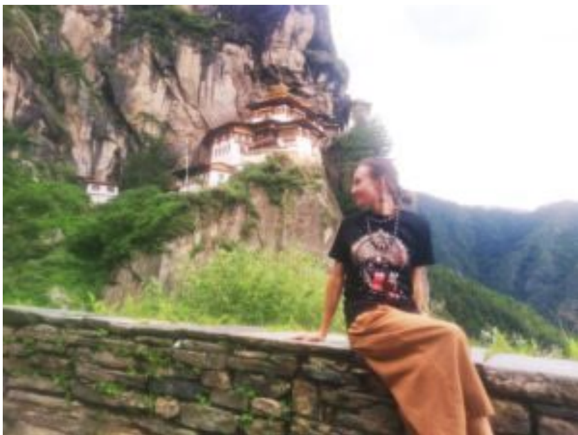
Гнездо Тигрицы, монастырь Такцанг

Падмасамбхава со своими женами практиковал в этом месте, названном впоследствии Гнездом Тигра, или Такцангом. Ну, знаете, на его фоне еще Виктор Пелевин сфотографировался в футболке со словами из французской песни. Хотя, это все же тигрица, а не тигр: ее пещера ниже, чем пещера Гуру Ринпоче, туда можно спуститься по нескольким уровням навесных деревянных лестниц.