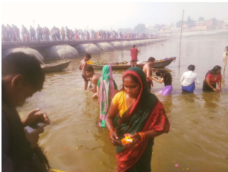
Понтонные мосты как инженерное чудо