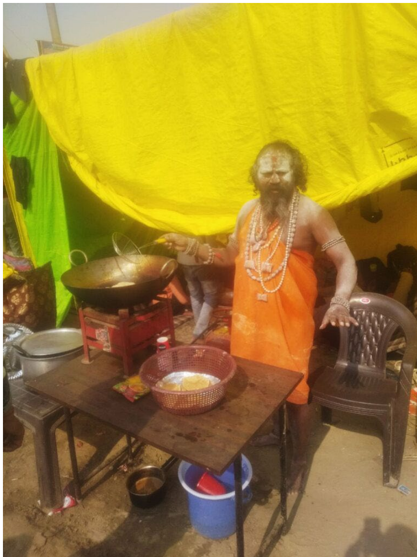
Kiss the cook